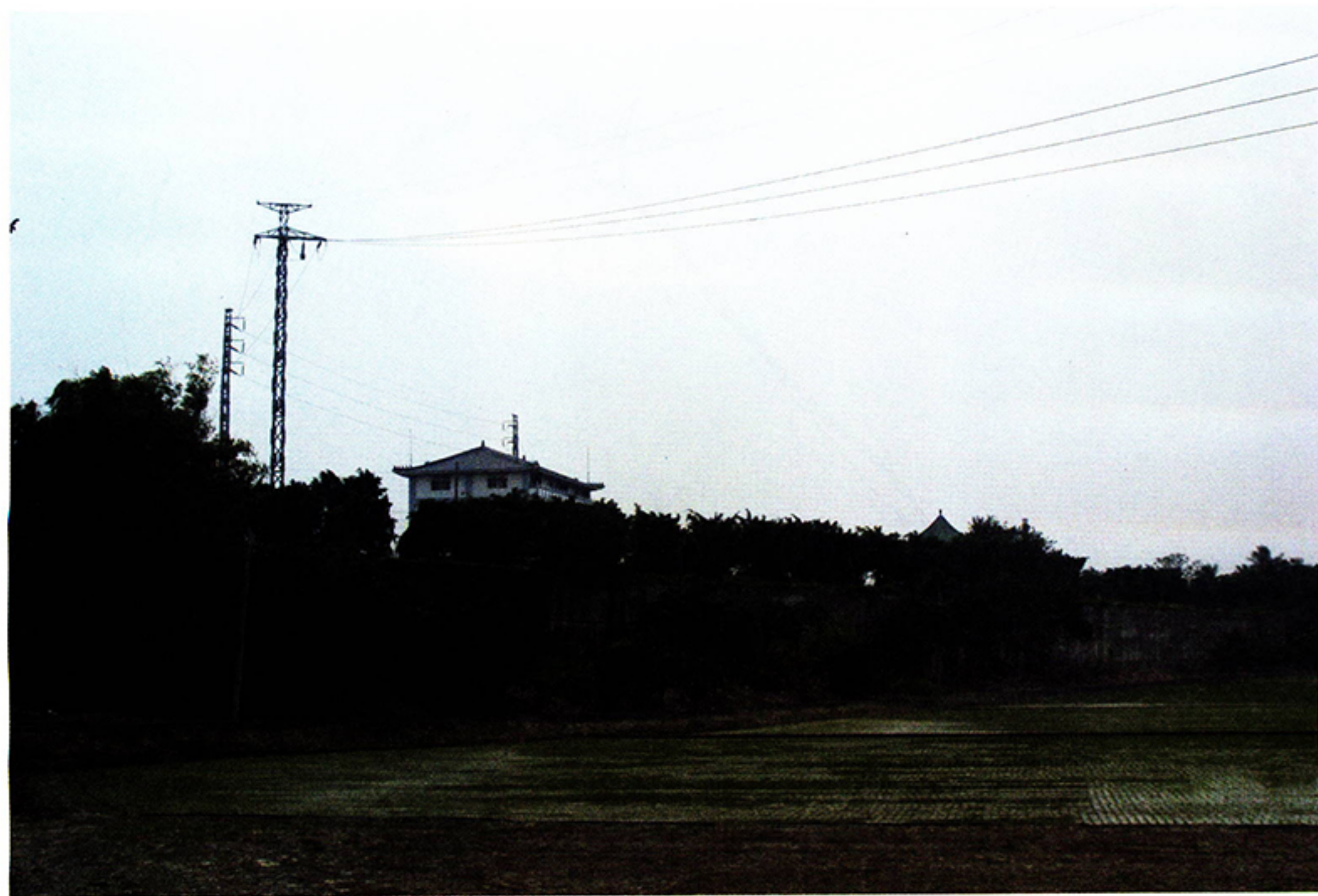
圖四·從南 175 線道路往新市鄉潭頂村望去，明顯地看出潭頂與大潭底兩地之落差。

大潭底莊地勢較低的原因，根據民間口碑係該莊原為菜寮溪河道，今之灰礫溝即為舊河道遺跡，潭內八莊沿著舊河道北岸而立，後來菜寮溪改道由今玉蜂大橋附近注入曾文溪，潭內八庄之南路頭、磚仔井、破廟仔、火攻潭等聚落逐漸沒落，走向廢莊命運。地理學者認為灰礫溝原為曾文溪主流，大約一百五十年至二百年前，曾文溪主流出新化丘陵後，原本由今山上鄉新莊聚落流向西南，經臺糖那拔林農場北側後折向西北，轉北於五鈴仔匯入今河道。舊河道遂逐漸廢棄，而出現地名「新莊」的聚落 12 。