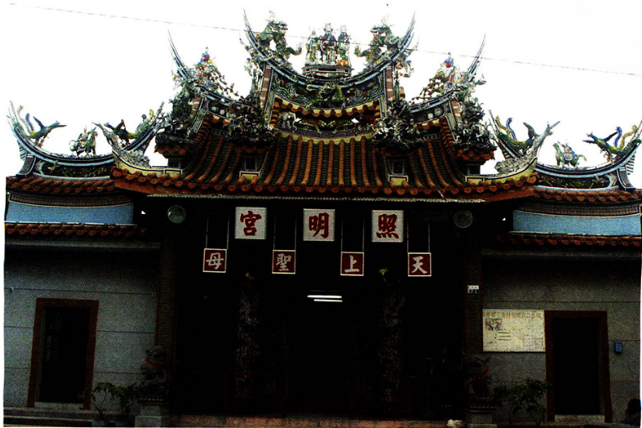
圖五·照明宮內匾額落款及沿革，仍標示「椰樹腳」照明宮舊名。

除了臺灣縣諭示外，我們從一張光緒十二年（一八八六）的借銀狀，也可看出椰樹腳莊有施琅租業，茲抄錄於下供讀者參考：