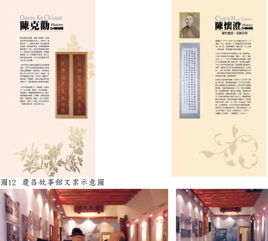
圖12為慶昌故事館內部的文案,預定介紹的有「慶昌行家族」、 「小廚司與大經理」、「慶昌行與戴潮春事件」、「陳克勸」、「陳懷澄」 與「陳培煦」,以及「不見天街泰興街路段」的輸出,將使人一目瞭然慶昌 家族史,並預定展示陳家的日常用品,以及陳懷澄、陳培煦的部分藏書及生 活照。2012年12月在所有設施完工後,業主特地邀請林會承教授與前屋主 陳仰止至意樓參觀,使其再生有其願景及改進的空間。