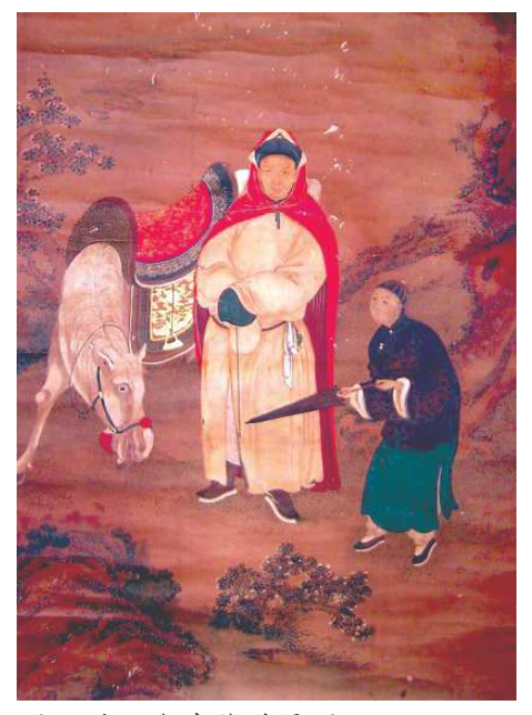
圖7 陳祈與書僮駿馬圖

清末的慶昌行尚有一知名人物,即十宜樓主人「陳祈」。意樓為七房 的祖厝,附近的十宜樓則為大房祖厝,其主人為「布政司經歷」的陳祈,因 早期鹿港鎮公所的資料介紹一直以「布政使」的身份流傳,致使其身世成 謎。在本案研究中藉著陳家大房保留的同治12年(1873)皇帝封贈之「敕 命」,對照陳家大房位於鹿港中山路147號二樓廳堂中的牌位,並比對日治 時期的戶籍謄本,得知「陳祈」應為陳克勸之孫陳秋鴻(?-1893),是為 大房長孫陳耀郁之弟。而「陳祈」為其官名,官銜布政司經歷是為虛官,最 初為邑庠生再經軍功或捐貲加以封贈,又因布政司經歷為從六品官,因此聖 旨內容以「敕命」稱之。但陳祈的神主牌位卻以「奉政大夫」稱之,是為 封贈之五品官,何時由六品官升為五品官,時間並不確定,於清末1887年 (光緒13年)彰化元清觀重修時的捐金記錄,陳祈頭銜為「候選同知陳祈 交來艮一百元,平六十八兩八俴」,由此可知其去世前已為五品官的同知 銜。<sup>21</sup>