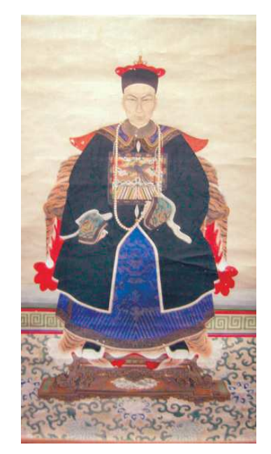
圖8 陳祈肖影 (資料提供: 鹿港民俗文物館)