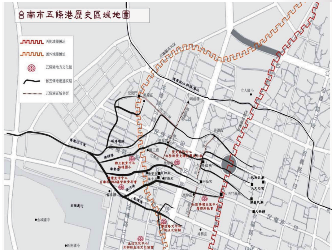
圖 3：五條港歷史區域圖