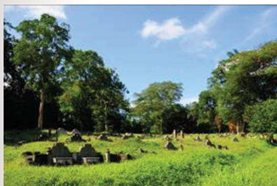
照片 9 王氏太原山墓塚