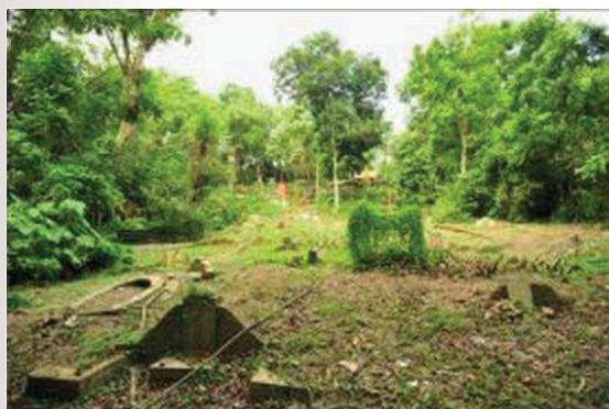
照片 7 新恒山亭墓塚

金門會館並沒有像其他宗親組織如福建會館、潮州義安公司、廣惠肇、客屬嘉應及豐永大等機構，設立義山，作為自身族群慎終追遠的安息之地。開埠以來，閩南族群的主要塚山為恒山亭、新恒山亭（照片 7）、麟山亭（照片 8）及如王氏太原山（照片 9）、楊氏協源山（照片 10）等血緣族群之墳地。作為小眾的金僑，在去世後主要是依照地緣或血緣的認同，附葬于上述閩南族群所屬的塚地（以恒山亭、麟山亭為主）。