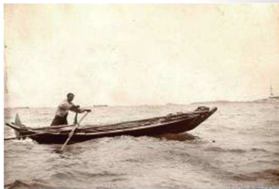
照片 18 十九世纪的舢舨業者