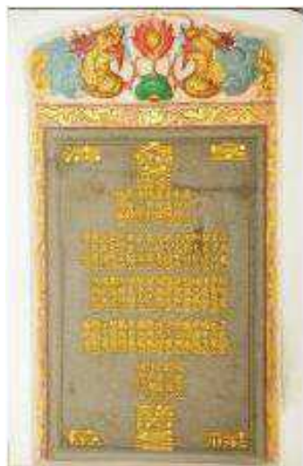
照片 5 浯江孚濟廟祿位碑