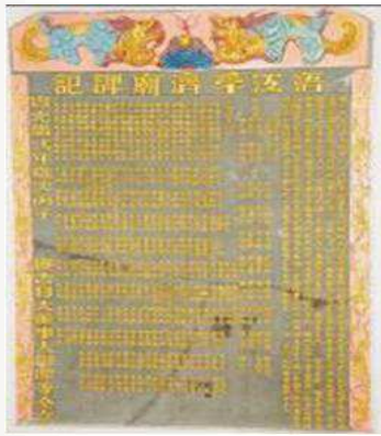
照片 3 語江孚濟廟碑記

從金門南來的邑人日益繁多，希望旅居南洋的金門同鄉，能團結在一起，互助相維。孚濟廟（照片 4）的創建年代相較于金蘭廟、鳳山寺、天福宮等廟要來得晚，其實亦反映出金門族群的移民人數少於其他閩南族群，因此沒有創建會館團結鄉親的迫切需求。