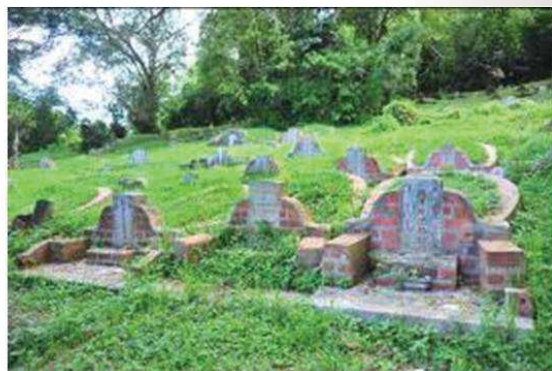
照片 12 武吉布朗墳山（二）