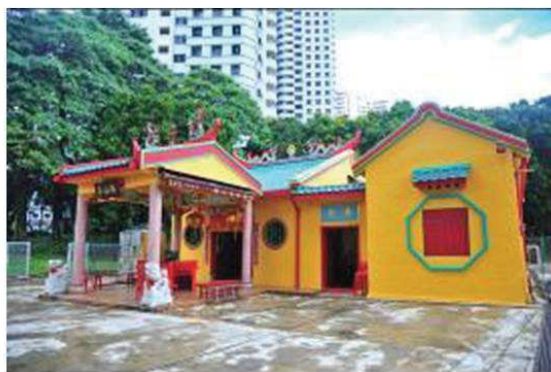
照片 8 麟山亭墓塚（現僅存宮廟）