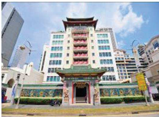
照片 1 中華商務總會 (即現新加坡中華總商會)