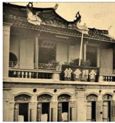
照片 4 語江孚濟廟