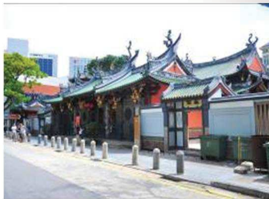
照片 2 天福宮

新加坡的華人人口從 1824 年的 3317 人增加至 1871 年的 97,111 人。年增率大概是百分之三。 7 清初以來，清廷實施海禁，嚴禁百姓出洋。尤其在 1860 年以前，移民新加坡的華人許多來自馬來半島及南洋各地，這個情況一直到 1840 年五口通商後，華工出洋的人數激增，不過清朝廷依然明令禁止。金門人南來的濫觴應當不晚於 19 世紀六十年代。