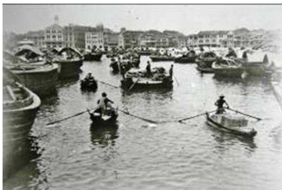
照片 17 百年前的新加坡河口