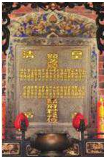
照片 6 慶德會祿位碑