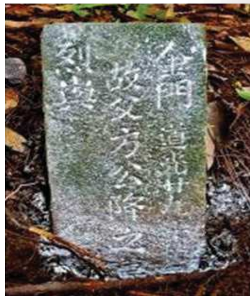
照片 14 金門烈嶼后頭方降墓塚 （道光 29 年立）