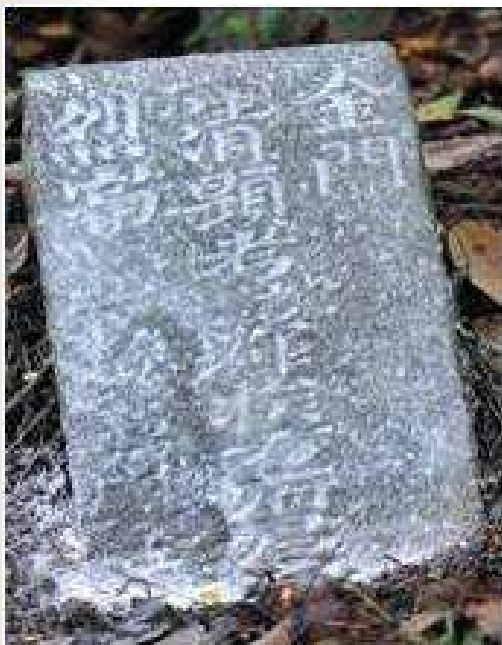
照片 15 金門烈嶼后頭方輝揆墓塚 (清，無立碑年款)