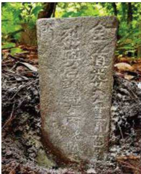
照片 13 金門烈嶼后頭方帆墓塚 （道光 29 年立）

這四方墓碑可說是《金門先賢錄 - 新加坡篇》附梓後，新加坡金僑史料的重要發現。尤其是第一方碑銘，甚為難得地鐫刻上“金門烈嶼後頭鄉”之地名（後頭鄉皆為方姓宗親）。墓主下葬年代為道光 29 年（1849 年），這也是目前所知，新加坡所發現最早的金僑墓葬。以這幾位鄉僑下葬的時間而言，顯然比立碑於 1876 年的《浯江孚濟廟碑記》上所記載的先賢落番時間要稍早。