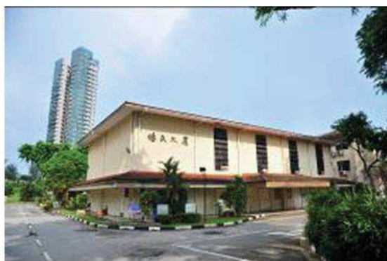
照片 10 楊氏協源山墓塚