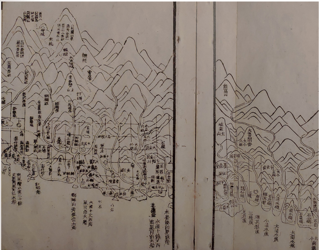
圖 1 後山中北路庄社與歧萊秀孤巒卑南交界圖

但如果再看夏獻綸於《臺灣輿圖》中的〈後山總圖〉，其北路歧萊（奇萊）與中路秀孤巒的交界，是在今吉安鄉與壽豐鄉交界的木瓜溪；而中路秀孤巒與南路卑南的交界，即是今花蓮縣富里鄉與臺東縣池上鄉的縣界（請參閱圖 1）。