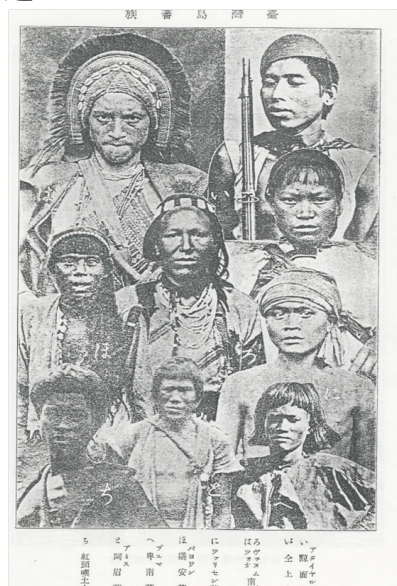
圖 1 「臺灣島蕃族」群組影像

臺灣全島原住民的族群分類，臺灣原住民的族群別的頭部影像群組、以及各族群的分布地圖，這些是伊能嘉矩的田野調查成果。然而伊能在田野調查過程中必須高度依賴已經熟悉地方蕃情的撫墾署，往往透過撫墾署協助，獲得該地方蕃情資料。換言之，撫墾署成立兩年期間的行政成果，是使得伊能嘉矩，乃至於其他的調查者如烏居龍藏，他們的田野調查工作成為可能的條件之一。