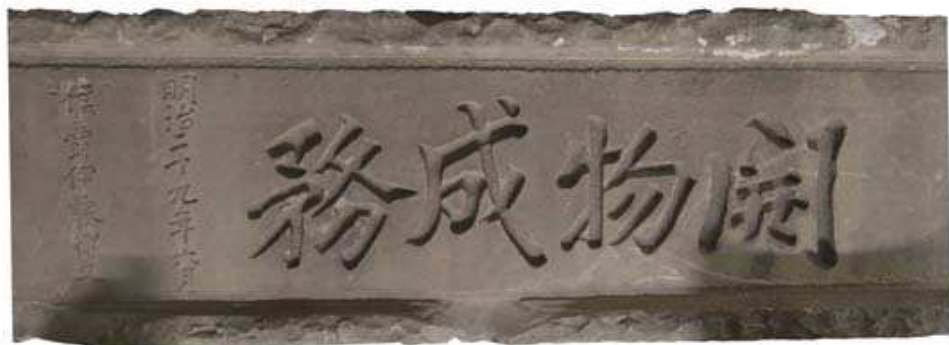
圖 3-1 「開物成務」石碑

館藏文物，如 85（1996）年洪敏麟顧問捐贈，原臺灣鐵路管理局南港隧道洞口上方伊藤博文題「開物成務」石碑（圖 3-1）；86（1997）年王宗老先生捐贈保管「大甲溪官義渡碑」；郭双富先生捐贈「第七任臺灣總督明石元二郎墓殘碑」（圖 3-2）；溪湖鎮奉天宮慈惠堂捐贈光復初期之寺廟壁堵人物剪黏等文物；建業公司捐贈「大正十三年彰化金刀神社石獅（狛犬）」（圖 3-3）等。