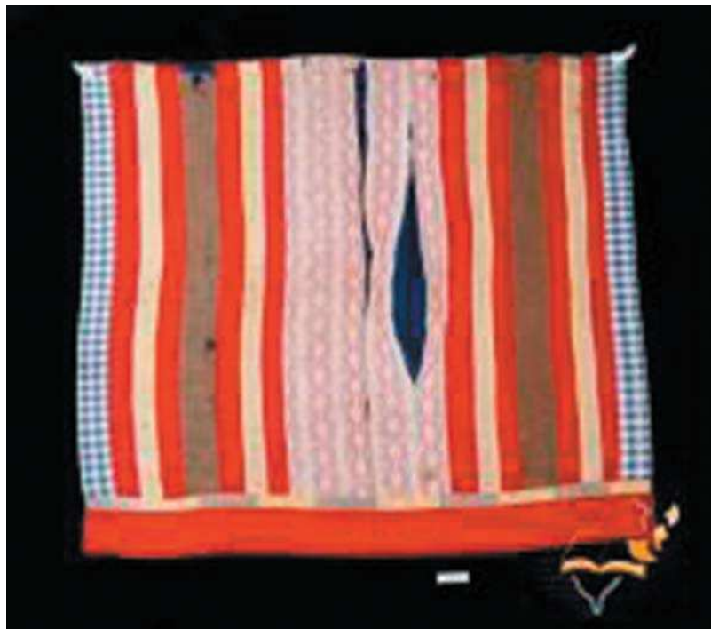
圖 3-13 卑南族男披肩成年男士的禮服包括披肩布在內，本藏尺寸寬大，以各色材質相異的布條以拼接方式製成。