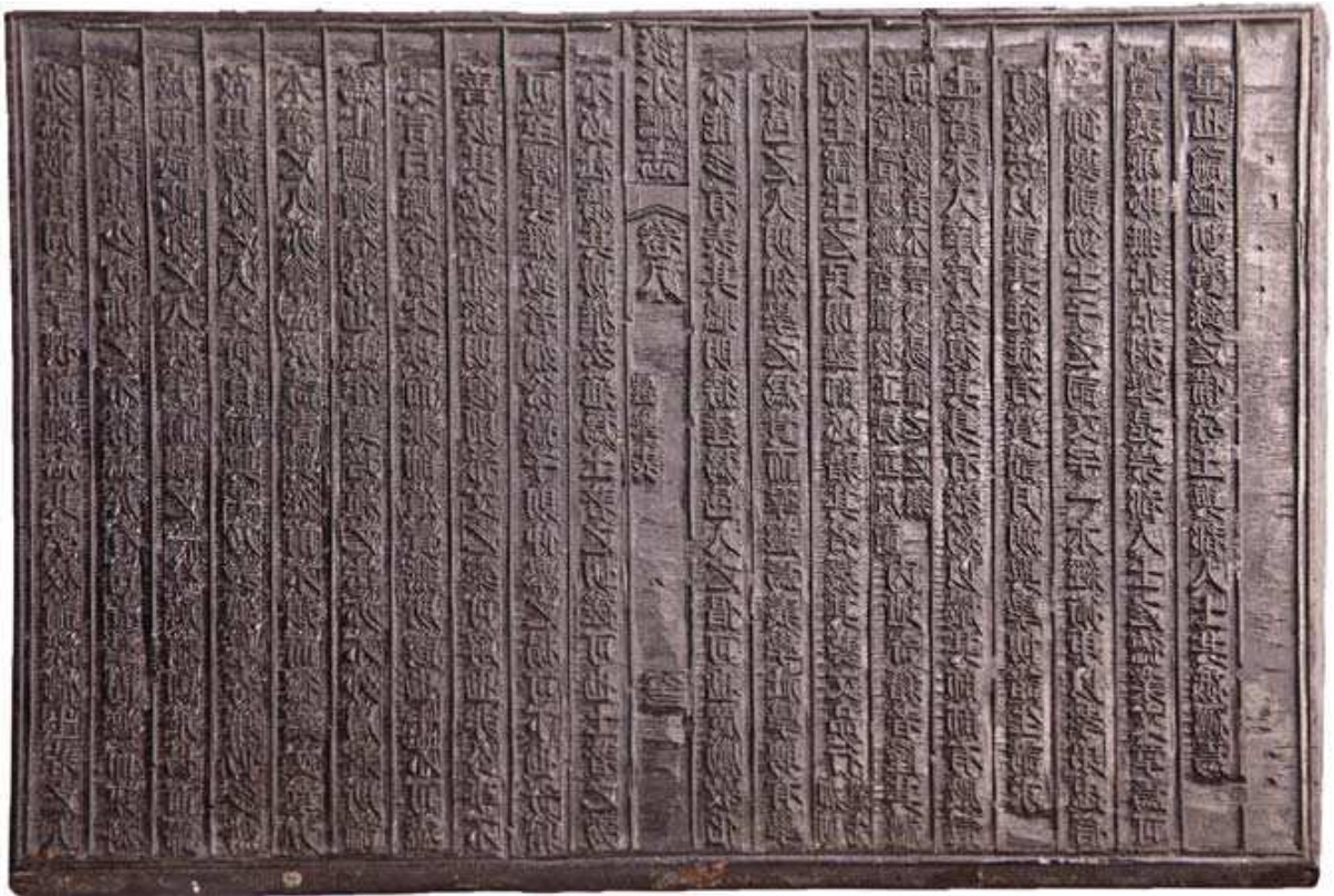
圖 3-5 淡水廳志木刻版