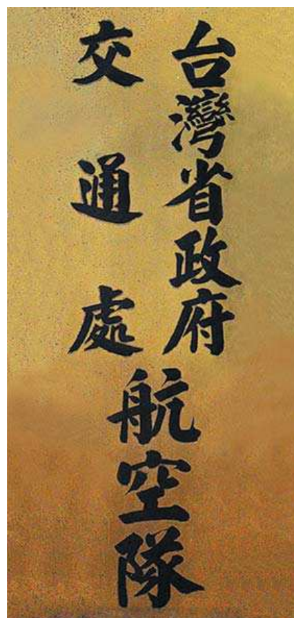
圖 3-8 臺灣省政府交通處航空隊名銜牌