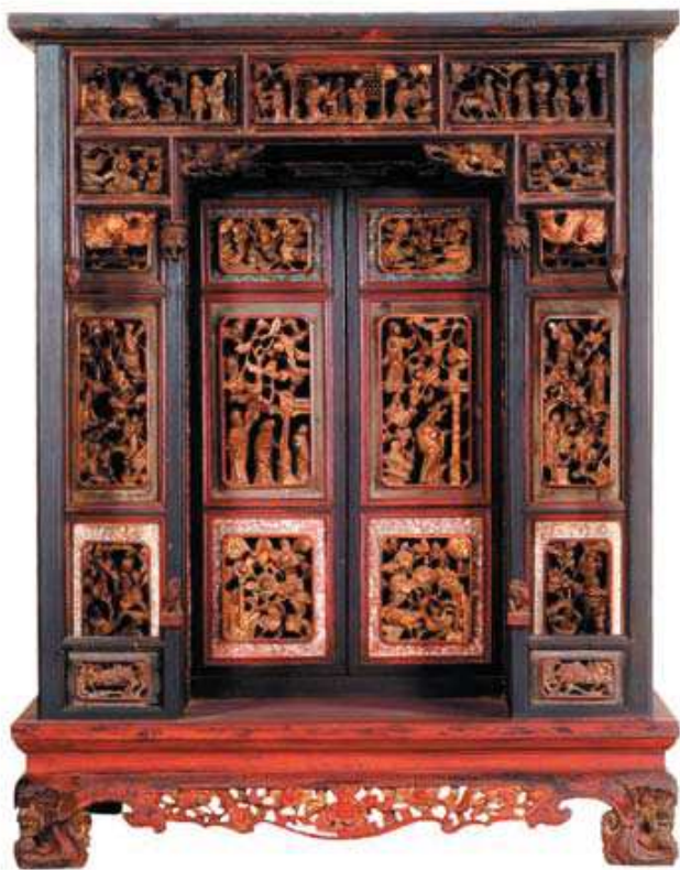
圖 3-9 神明龕，供奉祖先之用。

本館自 79（1990）年起，編列經費於文物購藏。配合臺灣歷史文化園區之籌建，文物大樓各展示室展示之規劃需求，積極且有系統購藏各項民俗文物，總計 81（1992）至 88（1999）年，加強建立開館基本館藏期間，計購藏近 6 千件文物。購藏文物中，原住民族文物約佔四分之一，包括現在列為珍貴動產的貝珠衣、拼板船，其次是生活工具和宗教祭儀文物。各項購藏文物，依文物大樓設計構想，規劃一系列常民文物常態展，及不定期的特展（圖 3-9 至 3-13）。