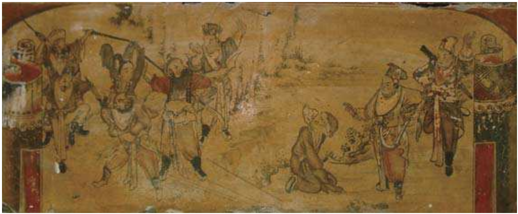
圖 3-17 敦德堂彩繪

敦德堂為草屯前清武秀才洪玉麟故宅，建於清末，閩南式四合院建築，牆堵彩繪、雀替、瓜桶、斗拱、樑柱，均施以彩繪或點綴書法，具有歷史意義和文化內涵。921 震災後，敦德堂廳堂兩旁廂房樑柱移位、牆壁裂縫，建築傾倒，無法重建。當時經南投縣民俗文物學會梁志忠理事長及草鞋墩鄉土文教協會李為國理事長熱心主動投入搶救，多方斡旋下，後讓與本館典藏，計 153 件。