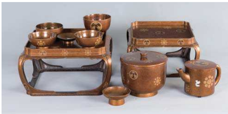
圖 3-6 臺灣總督府漆器 - 飲食道具

將機關名銜牌交本館典藏，共轉移機關名銜牌包含省府一級機關及部分二級單位 149 個。