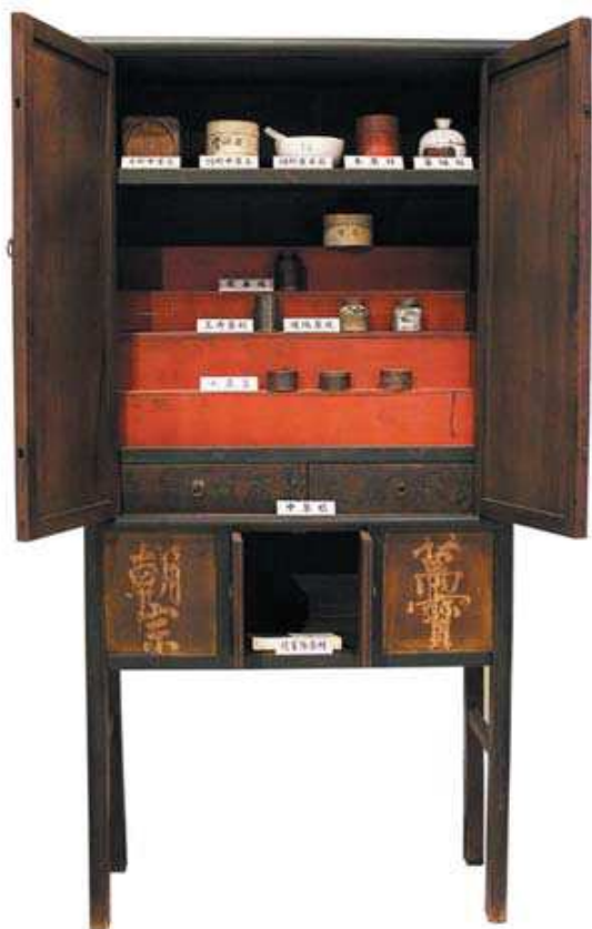
圖 3-15 陳緯一捐贈之中藥櫃，其中一座修復後展出

本件中藥櫃，係文物收藏家陳緯一先生捐贈。民國 94（2005）年，陳先生獲悉有人讓售整組中藥櫃，即當下決定購買送本館典藏運用。該中藥櫃係出自於苗栗三義地區中藥舖，約清末時期，共有 5 大櫃及帳務桌、置藥材盒、玻璃藥罐、切藥、製藥器具等 24 項 237 件。組件相當的完整已不多見，可藉之一窺臺灣早期傳統中藥舖的概貌，頗具展示與典藏價值。95（2006）年陳先生亦提供所藏古文書，與本館合作出版《力力社古文書契抄選輯－屏東崁頂力社村陳家古文書》。