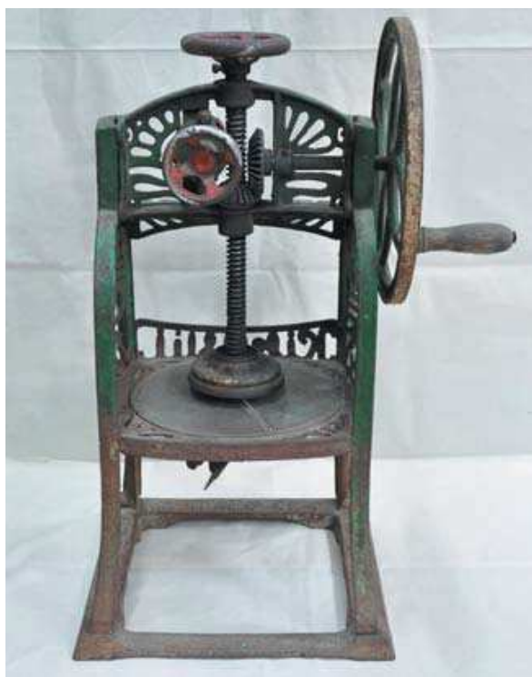
圖 3-16 廖大東先生捐贈之銼冰機。

本件中藥櫃，係文物收藏家陳緯一先生捐贈。民國 94（2005）年，陳先生獲悉有人讓售整組中藥櫃，即當下決定購買送本館典藏運用。該中藥櫃係出自於苗栗三義地區中藥舖，約清末時期，共有 5 大櫃及帳務桌、置藥材盒、玻璃藥罐、切藥、製藥器具等 24 項 237 件。組件相當的完整已不多見，可藉之一窺臺灣早期傳統中藥舖的概貌，頗具展示與典藏價值。95（2006）年陳先生亦提供所藏古文書，與本館合作出版《力力社古文書契抄選輯－屏東崁頂力社村陳家古文書》。