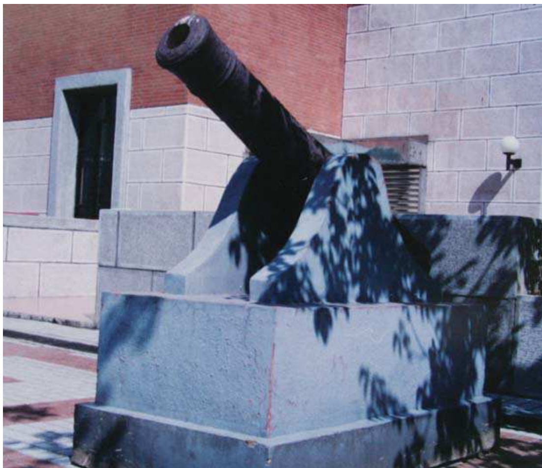
圖 3-4 臺灣水師協標左營大砲

古砲上有銘文「嘉慶 18 年夏 奉憲鑄造臺灣水師協標左營大砲 一位重一千觔」。按臺灣水師協標營，乾隆 53（1788）年改駐彰化鹿仔港，設四汛，各有炮臺，共「大銃炮二十四位」。日據時期移置於神社，於民國 83（1994）年由彰化建業公司捐贈本館典藏。