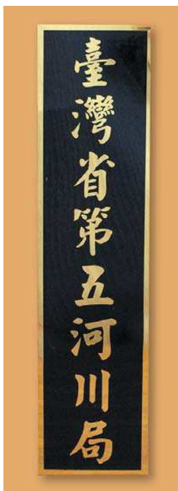
圖 3-7 臺灣省第五河川局名銜牌