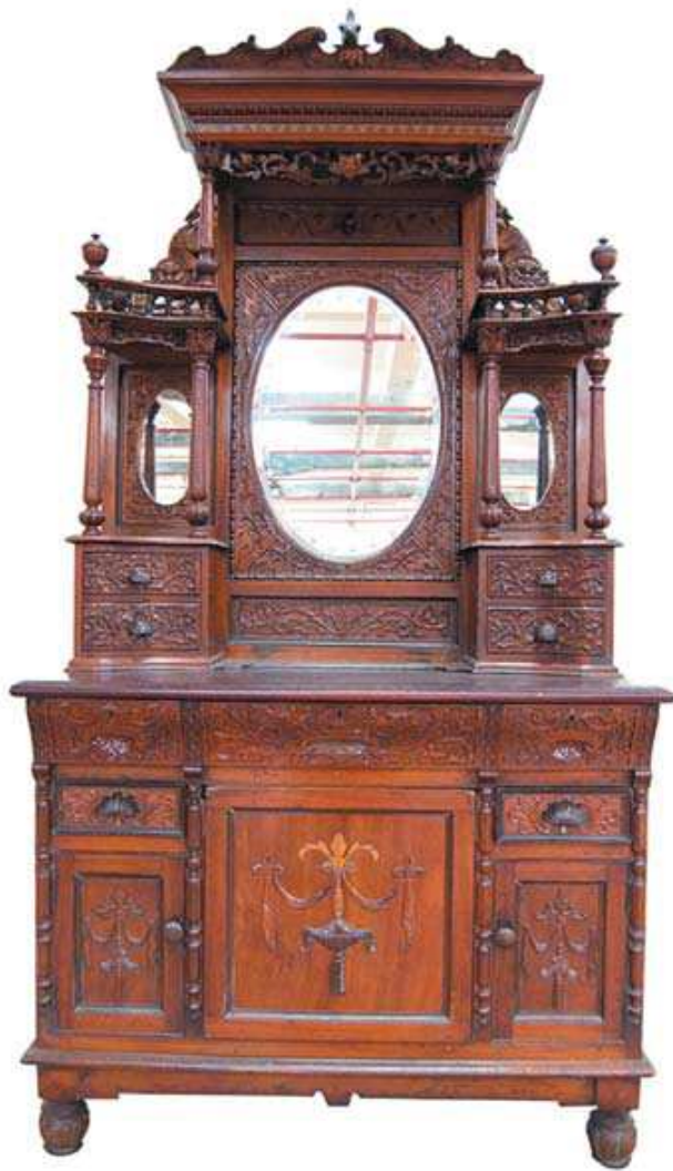
圖 3-14 黃陳淑美女士捐贈之鏡臺

86 (1997) 年彰化張洪米花女士捐贈所藏家具、神像服飾、農具、竹編、宗教器物 525 件；中寮鄉民廖大東先生捐贈家族契約文書相片 113 項及家藏文物 45 項 81 件；嘉義陳緯一先生收購後轉贈本館之清末苗栗三義地區中藥鋪組等等；黃則修遺孀陳淑美女士，103 (2014) 年捐贈家中珍藏文物與黃則修先生攝影器材、照片予本館。