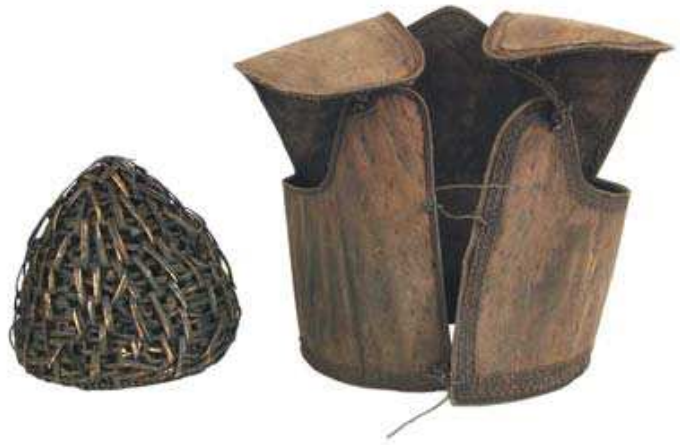
圖 3-12 達雅美族男椰鬚戰甲（蘭嶼紅頭）。