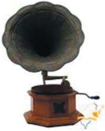
圖 3-11 百合喇叭型留聲機。