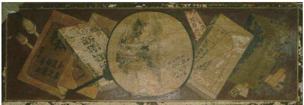
圖 3-18 敦德堂彩繪