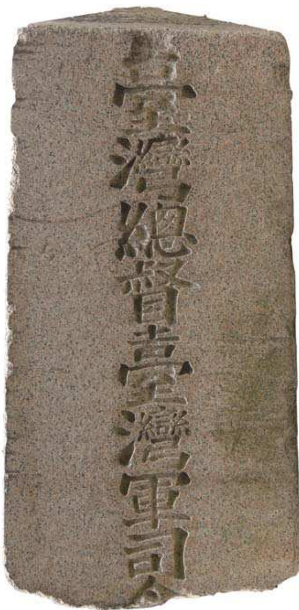
圖 3-2 明石元二郎墓殘碑

明石元二郎，大正 7(1918)年 6 月出任臺灣第七任總督，任內設立臺灣電力株式會社等措施，建樹效應長遠。大正 8(1919)年 8 月兼首任臺灣軍司令官。大正 8(1919)年 10 月病逝於日本，遺言遠葬臺灣，即今臺北市林森路第十四號公園處。後因故整建，改安放於三芝福音山，墓碑遭破壞而流入私人收藏。石碑原文「臺灣總督臺灣軍司令官陸軍大將男爵明石元二郎墓」，民國 94 (2005) 年郭双富先生購贈殘碑予本館典藏，極具歷史意義。