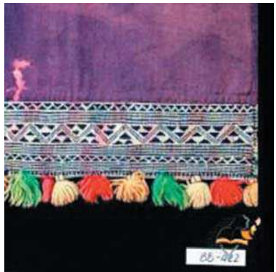
圖 3-10 平埔族腰帶（高雄甲仙）