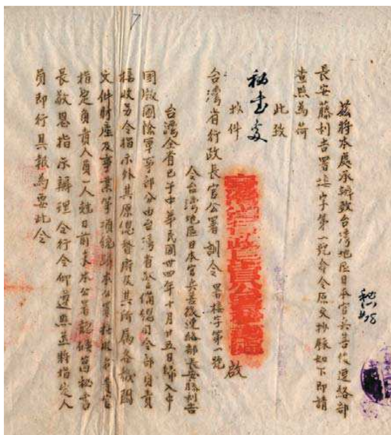
圖 4-1 公署署接字第一號訓令 日期：民國 34（1945）年 10 月 29 日

二、民政：各縣市政府員額編制、縣組織及區劃、民意機關組織、公職候選人、縣市參議員合格證書、國民身分證、行政會議、各縣市地方自治三年完成計畫、恢復國籍辦法、各縣政府區署鄉鎮民代表會、各縣市行政區劃、古今聖賢事蹟、各種工會、政治協商會議、日人聲請歸化案、各縣市造產辦法、各縣市面積人口組織圖表、高山族戶口調查、高山族教育事項、褒揚抗戰有功案、縣市村里民大會推行辦法、民政處接收案、高山同胞遷居案、地方自治實行法等案。