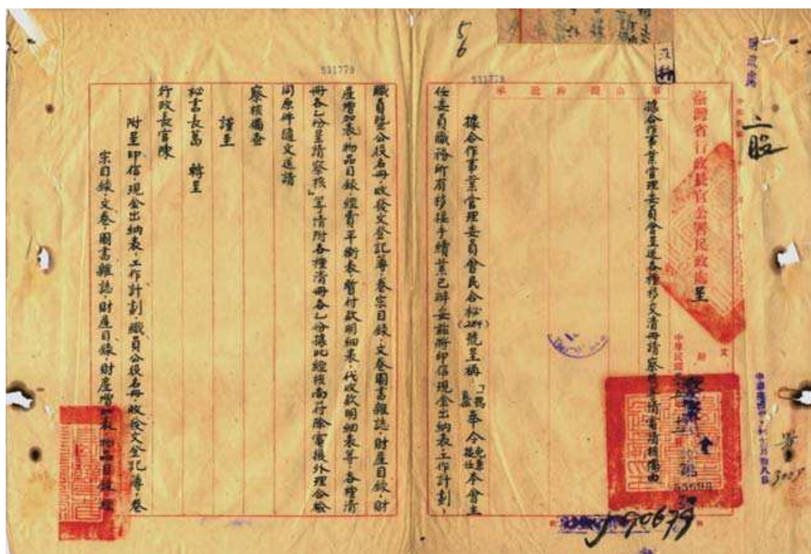
圖 4-3 合作事業管理委員會移交清冊 來源：臺灣省行政長官公署檔案 日期：民國 35（1946）年 12 月 18 日

爲南方返臺本省籍軍人欠薪證明書、交通處接收概報表、經建計畫中統計部門計畫綱要、申請賠償戰時保險金、臺灣產業金庫所有土地財產明細表、關於日人債務卷、關於臺灣朝鮮公私產業處理卷、整理臺灣總督府財務帳目卷、接收國有財產清冊、高雄港務局接收、專賣局移接、拓殖株式會社移接卷、臺灣省菸酒火柴專賣規則、頒發經濟緊急措施方案、非常時期農礦工商管理辦法、各級政府財政收支系統實施辦法、農林處各所屬接收存日資產評表、關於日本至臺灣所辦事業及在日資產、標賣日人財產案、臺拓佃租業務移交、設立實驗經濟農場、鐵路規章及法令、公路規章及法令等案。