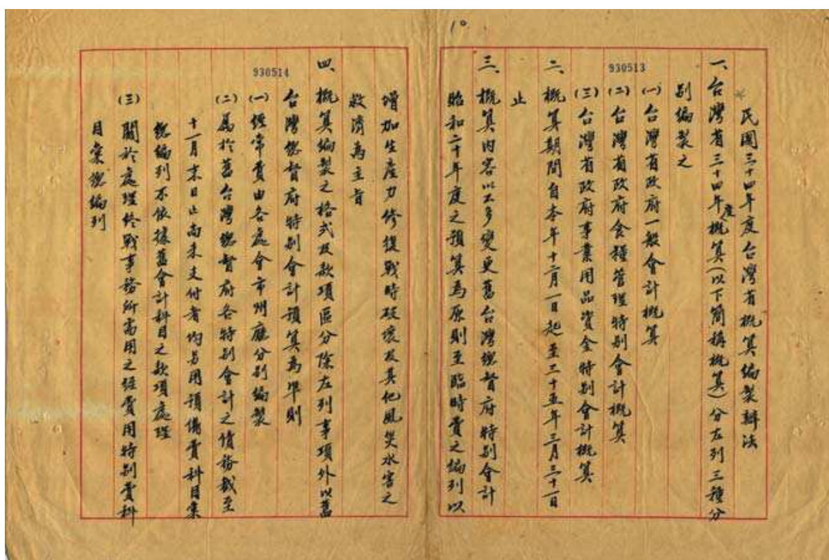
圖 4-5 民國 34 年臺灣省概算編製辦法

(三) 其他：含增進地方行政效率修訂縣長巡視辦法、省行政長官公署政務會議暫行辦法議事規則、縣市鄉鎮公產管理規則、公民訓練辦法、民選前區長任免辦法、收復區