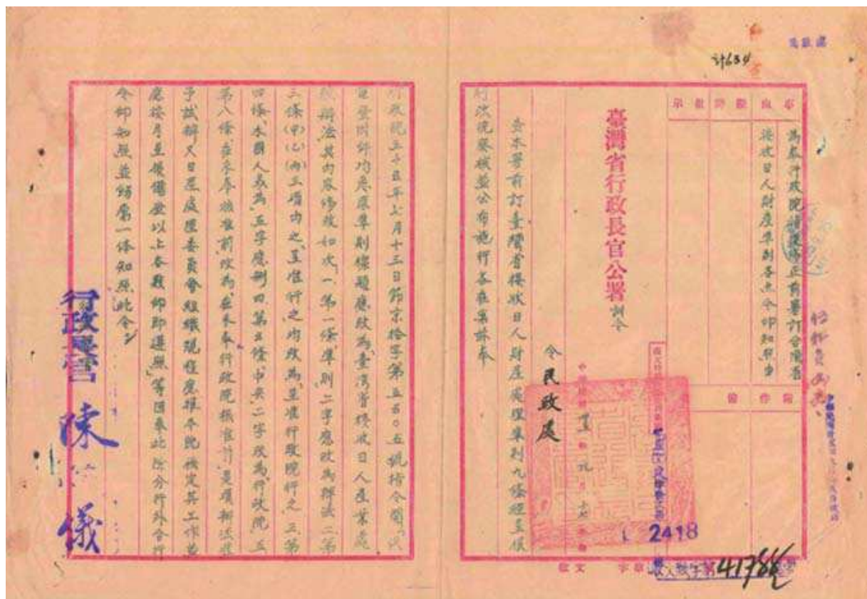
圖 4-4 接收日人財產準則