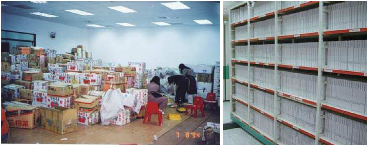
圖 7-1 臺灣省菸酒公賣局檔案移轉初期與現況

文獻會乃與公賣局總局洽談檔案移轉事宜，以保存珍貴史料。惟時間緊迫，加上公賣局分散全省各分支機構之檔案保存狀況不一，乃先進行整部移轉再陸續整理、上架；總計移轉 5 部卡車、數百餘箱檔案資料。這批資料仍以檔案居最大比率，但檔案包括與公賣局有關之民間團體檔案（例如：菸酒配銷聯合會檔案），亦即，本館典藏之公賣局檔案，事實包含其所屬或從屬之機關團體，體系複雜。