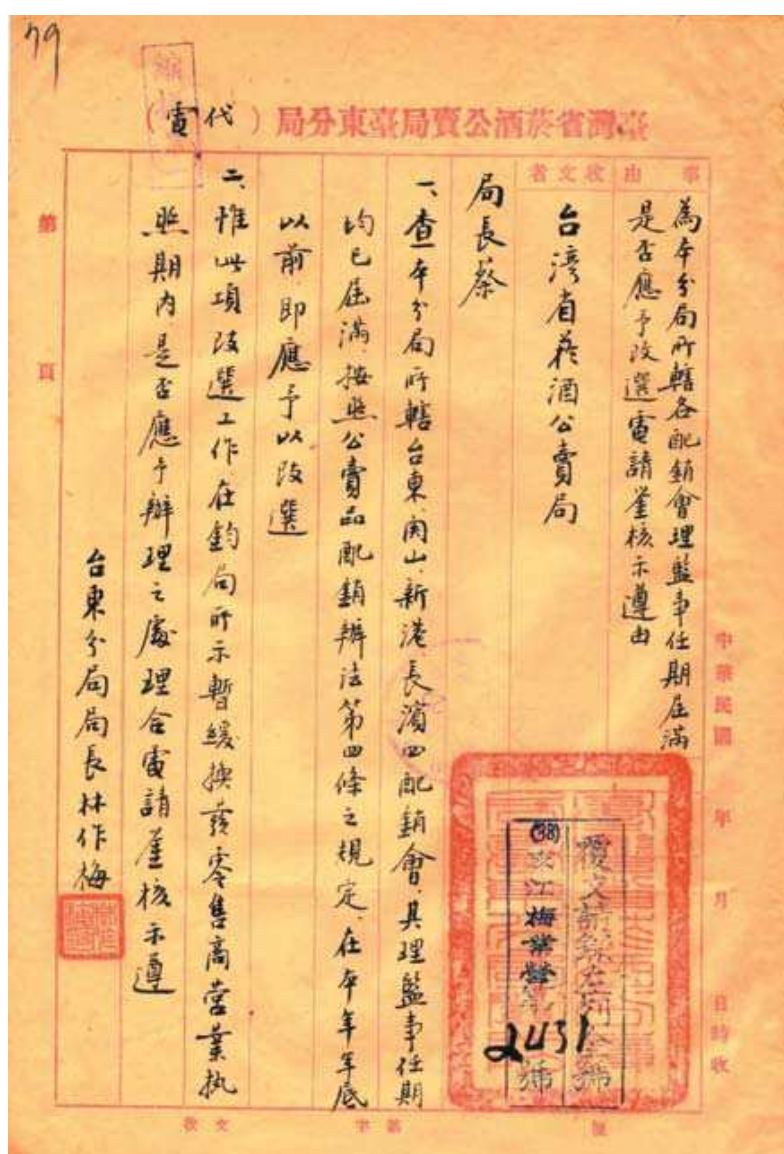
圖 7-3 臺東分局所轄各配銷會理監事改選案 日期：民國 38（1949）年 12 月 5 日

選、處理香煙攤販、耕種私煙處理情形、規定公賣品價格、配銷會（處）設置管理、設置山地聯合配銷所、菸酒配銷處等級及員額編制、各配銷機構收購房地產、零售商設置管理、菸葉耕作許可、偵查小組設置及管理、洋菸酒及緝私品配售憑證、取締違反公賣品價格、專賣法規修訂與解釋等案。