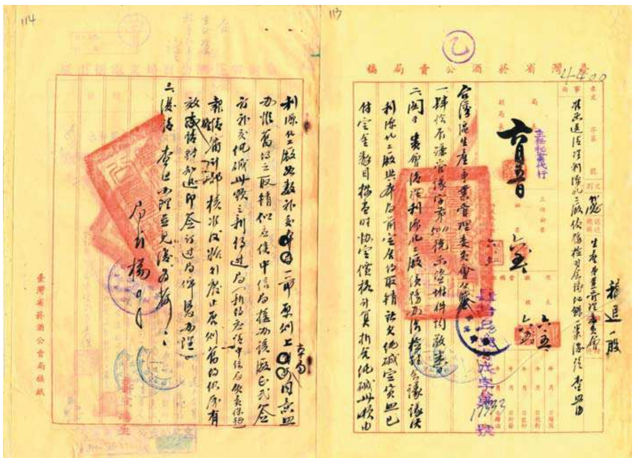
圖 7-6 利源化工廠債務檢討會議案