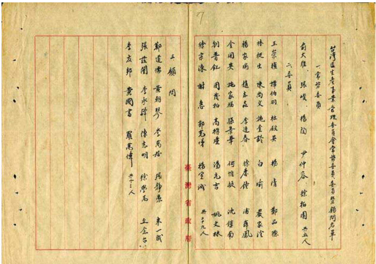
圖 8-2 最早的生管會常務委員、委員、顧問名單 日期：民國 38（1949）年 6 月 6 日

料獲得妥善保存，希望省文獻會考量將之永久典藏。接獲此訊息，省文獻會乃立即展開作業，於同年 9 月 10 日函請臺灣省政府秘書處惠允移轉典藏，這是本館保存「生管會」檔案的由來。爲了將此項檔案儘早提供各界人士參考、利用，於 87（1998）年即與中央研究院臺灣史研究所、經濟研究所等進行合作，共同整理及編目建檔，並製作完成 4,738 卷檔案的清冊，以及合計 220,336 頁的黑白影像掃描光碟。